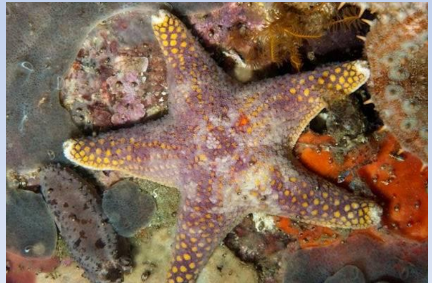
Obrázek: Hvězdice půvabná

http://upload.wikimedia.org/wikipedia/commons/thumb/d/d3/Purple_reticulate_starfish_Henricia_ornata_DSF8941.jpg/401px-Purple_reticulated_starfish_Henricia_ornata_DSF8941.jpg