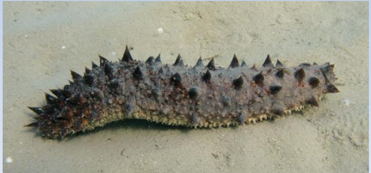
Obrázek: Sumýš obecný