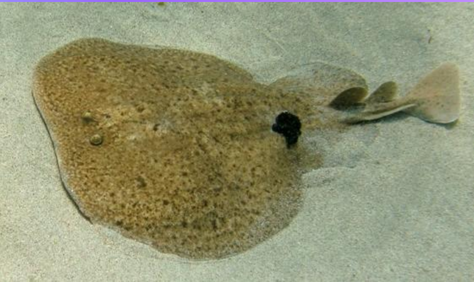
Obrázek: Parejnok elektrický