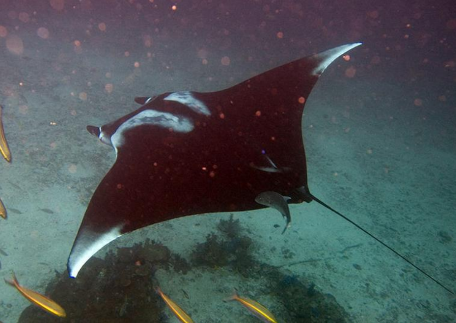
Obrázek: Rejnok manta

http://upload.wikimedia.org/wikipedia/commons/thumb/4/4b/Manta_birostris-Thailand3.jpg/800px-Manta_birostris-Thailand3.jpg