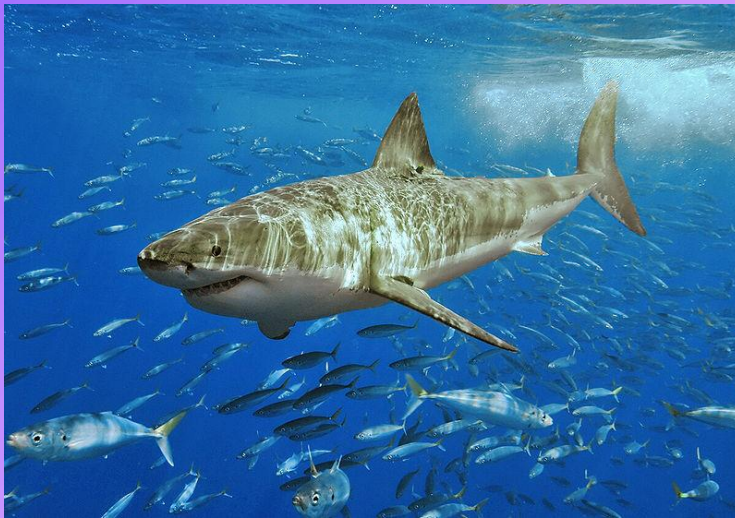
Obrázek: Žralok bílý